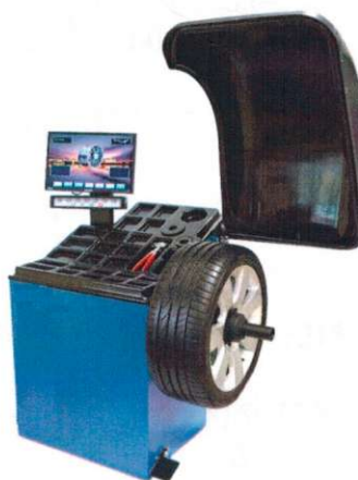
Рисунок 5 - Общий вид станков балансировочных ЛС433