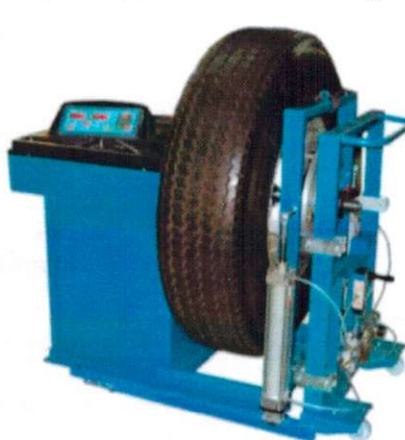
Рисунок 3 - Общий вид станков балансировочных ЛС322