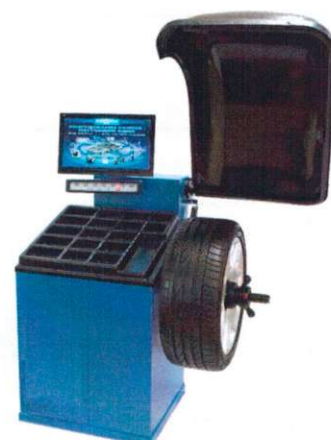
Рисунок 4 - Общий вид станков балансировочных ЛС432