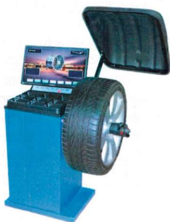
Рисунок 2 - Общий вид станков балансировочных ЛС131